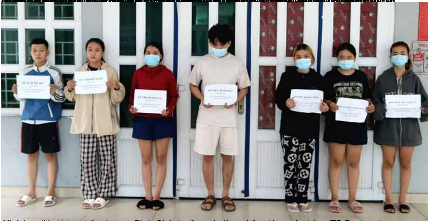
Nhóm người đi mua hàng ở huyện Bình Chánh cũng đi làm nhân viên ngân hàng TP Bank đi